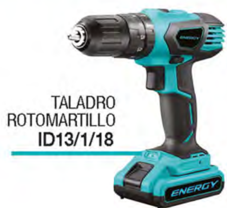
TALADRO ROTOMARTILLO ID13/1/18