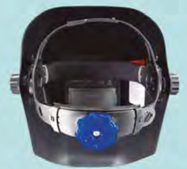
Suspensor confort ajustable