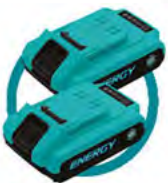
2 Baterías 18V - 1,5 Ah