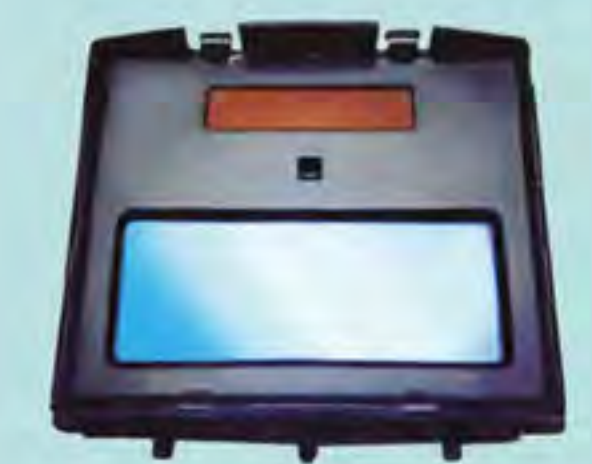
Fotoceldas Sensor Fotosensible