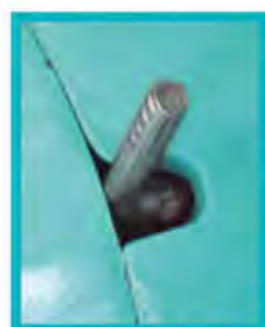
Perilla de traba de Disco