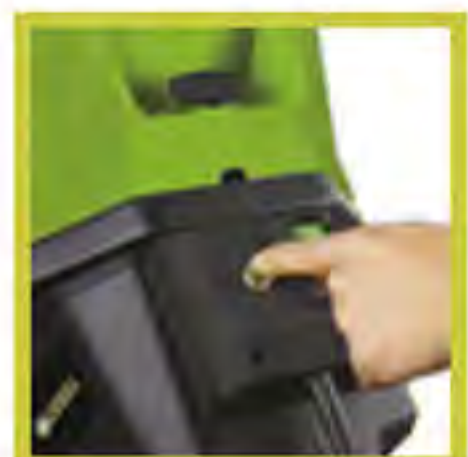
PROTECCIÓN CONTRA SOBRECARGA