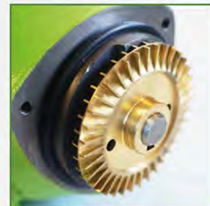
Turbina de Bronce